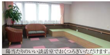
陽当たりのいい談話室でおくつろぎいただけます。