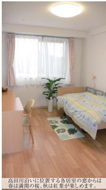
高田川沿いに位置する各居室の窓からは春は満開の桜、秋は紅葉が楽しめます。