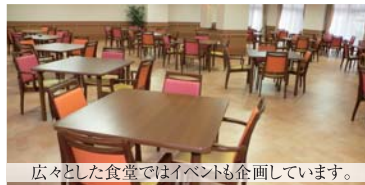
広々とした食堂ではイベントも企画しています。